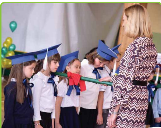
WITAJCIE W SZKOLE!