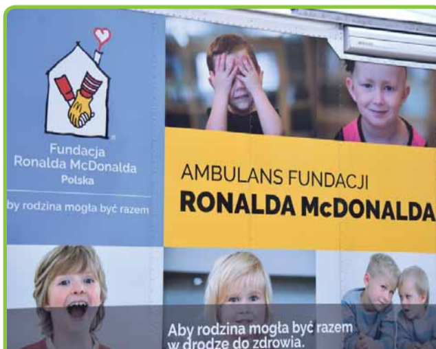
ZAPISZ SWOJE DZIECKO NA BADANIA