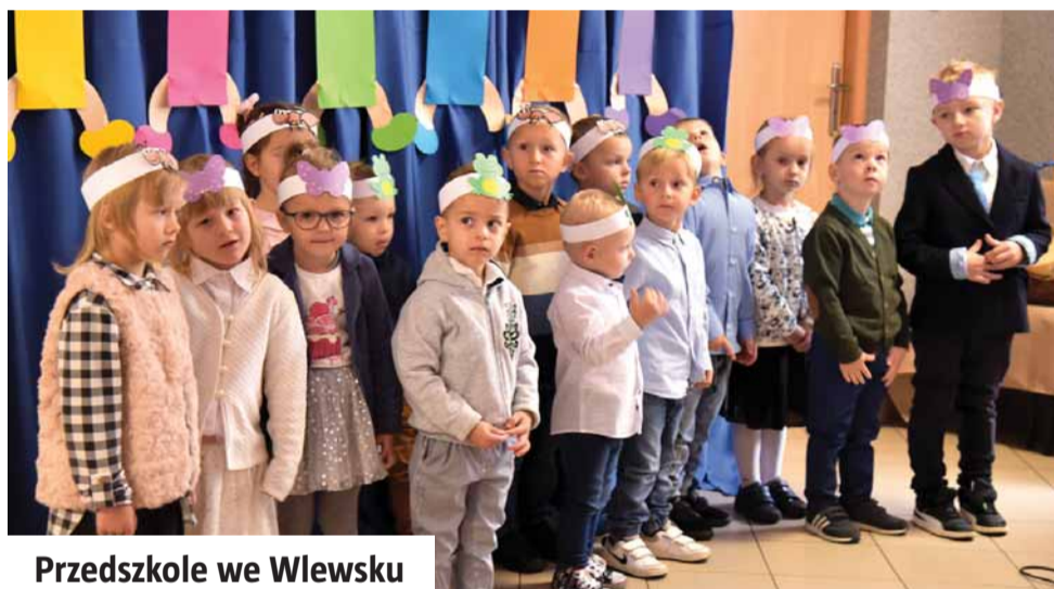
Przedszkole we Wlewsku