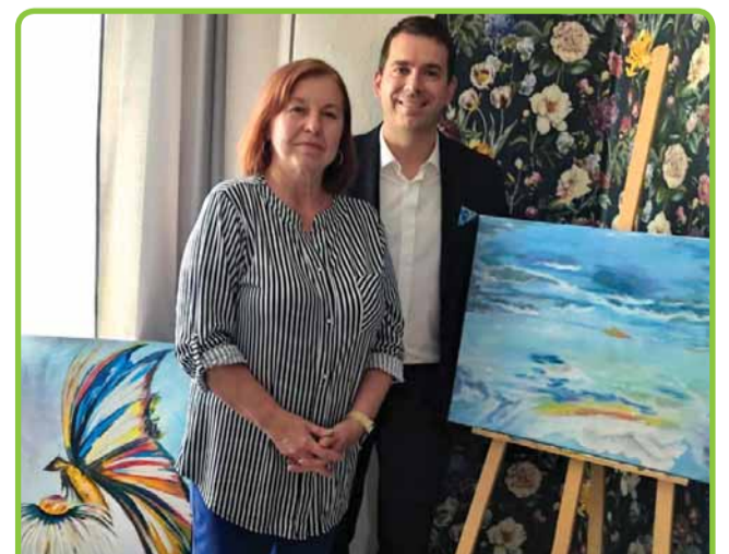
SZLAKIEM LIDZBARSKICH TALENTÓW